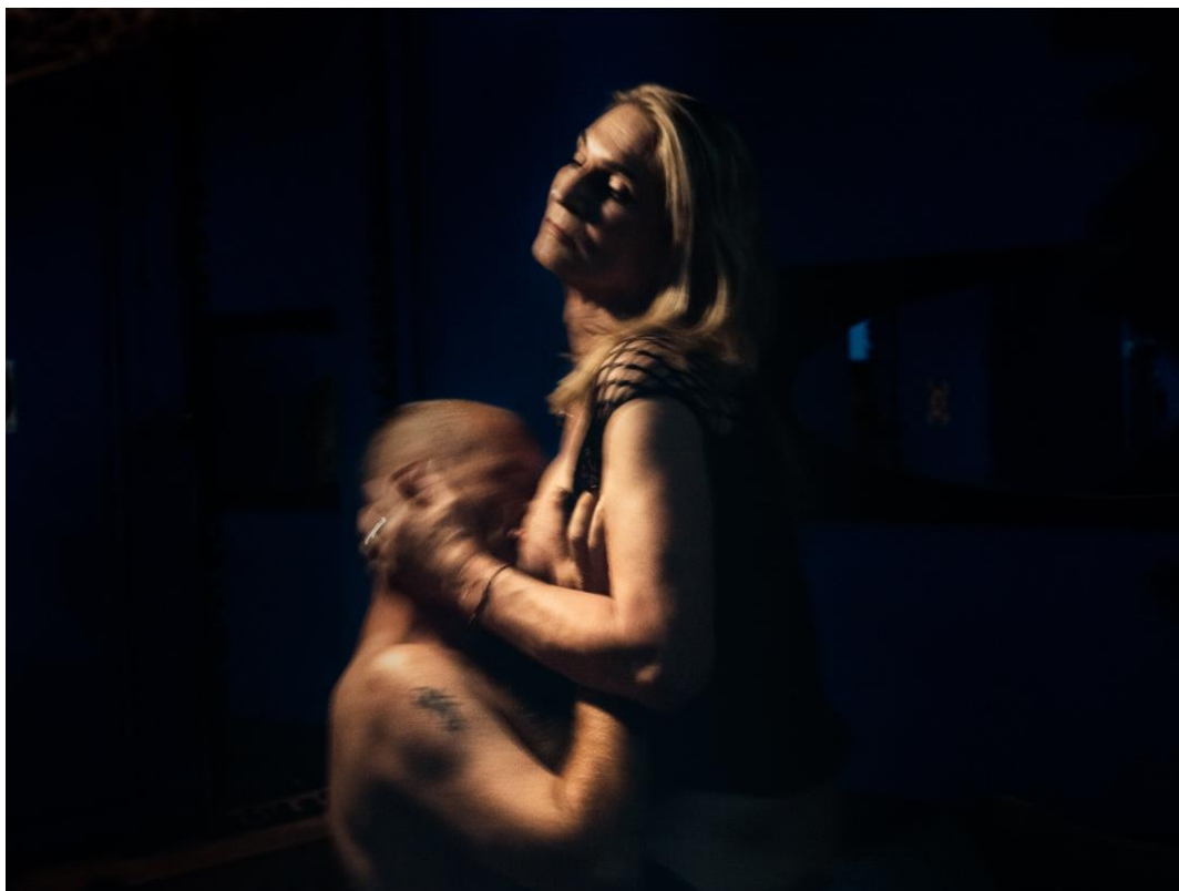
GUILLAUME PERRET, PHOTOGRAPHIE DE LA SERIE « AMOUR »